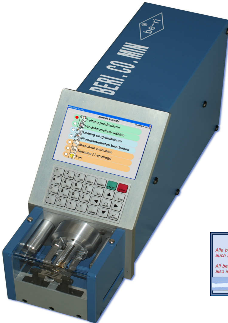
Abbildung Maschine ohne Schutzhaube