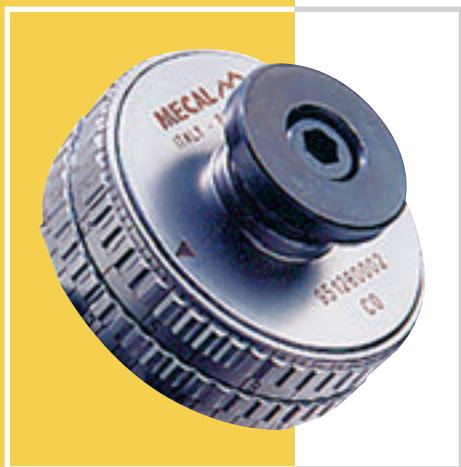
Reglajul fin al inaltimii de sertizare in pasi de 0,02mm